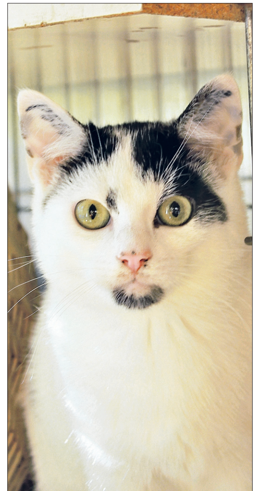
Sind bereit für eine neue Familie: Timmi und Pierrot.